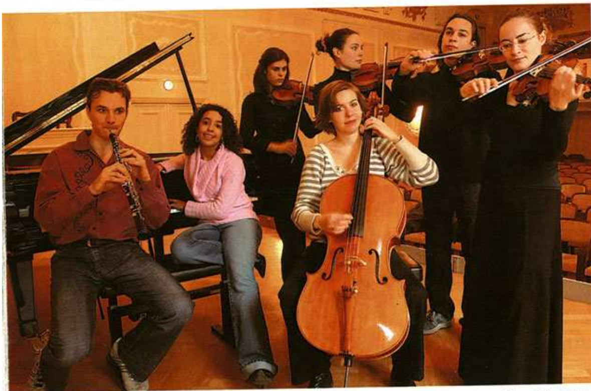
Un groupe d'étudiants français du Mozarteum. Plus de cinquante nationalités sont représentées parmi les 1 700 inscrits de cette université d'élite.

Par roulement, plus de 400 enseignants y exercent leur activité. Eux aussi viennent de tous les pays. Souvent célèbres – ils donnent des récitals dans les plus grandes salles de concert –, ces maîtres s'attachent à transmettre leur savoir et à faire fructifier les talents de leurs élèves. Car on n'entre pas au Mozarteum sans montrer patte blanche : les candidats subissent un examen d'admission qui n'a pas la réputation d'être facile. L'excellence reste l'impératif d'une institution qui se vante à bon droit de mener ses lauréats au niveau exigé par une carrière internationale.